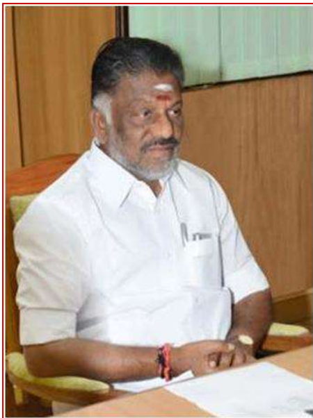
〈パンニールセルヴァム新州首相〉

因みに、ジャヤラリタ州首相が任期中に州首相職をしたのは今回が 2 度目である。1 度目は 2001 年 9 月、TN 州小企業公社(TNSIC)の土地売買に係る裁判で有罪判決を受け、州首相職を失った。その際もパンニールセルヴァム州財務大臣が州首相として選出されている。なお、この裁判では 2002 年 3 月に無罪判決が確定し、ジャヤラリタ女史は州首相に復帰している。ジャヤラリタ女史は、これら以外にも多数の汚職疑惑で裁判沙汰になっているが、いくつかは TNSIC 裁判のように勝訴している。