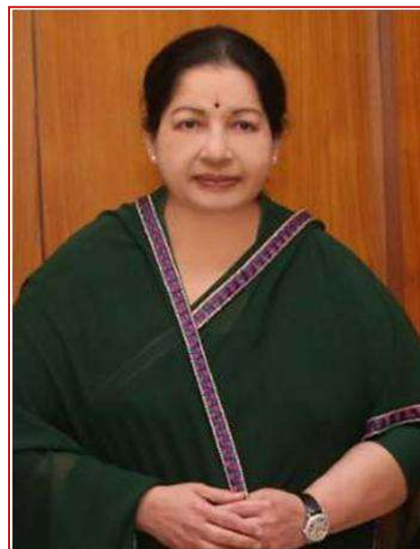
〈ジャヤラリタ前州首相〉