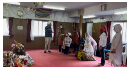
メンバーによるシク教寺院見学 (Guru Nanak Darbar Kobe 神戸市)

ネット上で知り合ったインド仲間が集まってオフラインのミーティングも企画された。サイバー世界で知り合った全くの見ず知らずの人達がリアルで対面する。「インドの衝撃」の通称「オフ会」は現在も2か月に1回程度の頻度で継続中である。一緒にカレーを食べたり映画を見たり、インド関連の施設を一緒に遠足のようにして見て回ったりした。