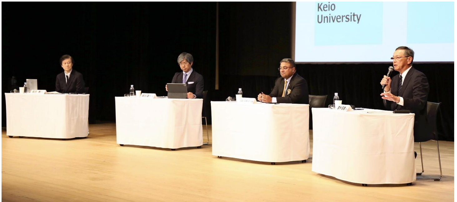
読売国際会議 2023 「日印協力が果たすべき役割」

公益財団法人 日 印 協 会 (日印間の政治・経済・文化・人的交流に貢献して 120 年)