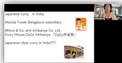
料理研究家と Zoom で結んだ (近畿大学と慶應義塾大学の合同授業)

「インドの衝撃」を通してお知り合いになった方々に、筆者が勤務している大学授業でゲストとして講義をしていただいたこともある。ウッタラカンド州在住の料理研究家の女性には、立教大学や近畿大学で生中継オペレーションをしていただき、インドの家庭料理の調理方法やその背景インドでの暮らしと家族関係などについて、学生からの率直な質問に答えていただいた。慶應義塾大学との合同授業では、インドのカレーの魅力について英語での授業を行った。直接インド在住の方の実感を聞く機会となり、学生たちの反響もすこぶるよかった。