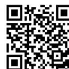
「インドの衝撃」 (リンク集QRコード)