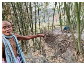
マニプール州のお話で、「この老人が指をさして教えてくれたものは？」

マニプール州の説明で先生が出したクイズも私の心に残った。この老人が指差す先には何があるのか。答えは日本軍の遺骨。この老人の話では自分が死んだら遺骨の場所はわからなくなってしまうので、早く取りに来てほしいと言っていたようだ。