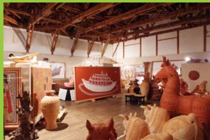
ミティラー美術館展示室