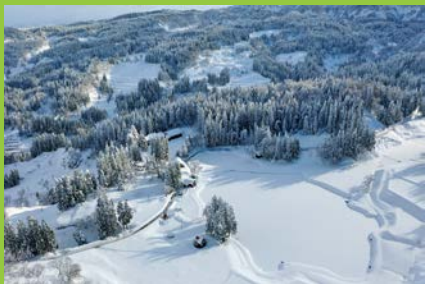
上空より眺めたミティラー美術館