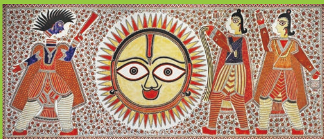
ポーワ・デーヴィー 《太陽神スーリヤ》 Bauwa Dev 《Sun God-Surya》 1992年/162×366cm